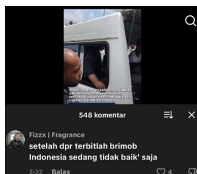
Gambar 2. Komentar Kedua

Analisis komentar netizen menunjukkan bahwa bentuk tindak tutur tidak hanya terbatas pada ekspresif dan direktif, tetapi juga menunjukkan adanya nuansa implikatur, kekhawatiran sosial, serta kritik tersirat terhadap kondisi sosial dan institusi negara. Pada komentar pertama oleh akun @parupuy yang berbunyi "ntahlah mau komen tapi gak heran", terlihat adanya tindak tutur ekspresif yang bersifat apatis sekaligus sinis. Ujaran ini tidak secara langsung mengkritik, tetapi mengandung implikatur bahwa peristiwa kekerasan tersebut sudah dianggap sebagai hal yang biasa terjadi. Sikap "tidak heran" menunjukkan adanya penurunan kepercayaan terhadap institusi, yang disampaikan secara implisit. Menurut Kunjana Rahardi (2022), implikatur dalam komunikasi digital sering digunakan untuk menyampaikan kritik secara tidak langsung guna menghindari konflik terbuka, tetapi tetap dapat dipahami oleh audiens melalui konteks sosial yang sama.