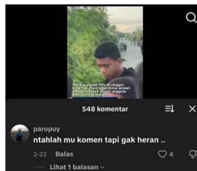
Gambar 1. Komentar Pertama

Hasil penelitian ini menunjukkan bahwa media sosial berfungsi sebagai arena demokratisasi bahasa, di mana setiap individu memiliki kesempatan yang sama untuk menyuarakan pendapat. Namun, kebebasan ini juga dapat menimbulkan polarisasi opini, terutama ketika komentar yang muncul didominasi oleh emosi negatif. Dalam hal ini, tindak tutur ilokusi tidak hanya mencerminkan sikap individu, tetapi juga dapat membentuk wacana kolektif yang memengaruhi persepsi publik terhadap institusi tertentu. Secara keseluruhan, temuan penelitian ini menegaskan bahwa analisis tindak tutur ilokusi dalam komentar media sosial dapat memberikan gambaran yang mendalam mengenai respons masyarakat terhadap isu sosial. Dominasi tindak tutur ekspresif dan direktif menunjukkan bahwa masyarakat cenderung menggunakan bahasa sebagai alat untuk mengekspresikan emosi sekaligus menuntut perubahan sosial. Oleh karena itu, studi pragmatik menjadi sangat relevan untuk memahami dinamika komunikasi di era digital, terutama dalam konteks peristiwa yang menarik perhatian publik secara luas.