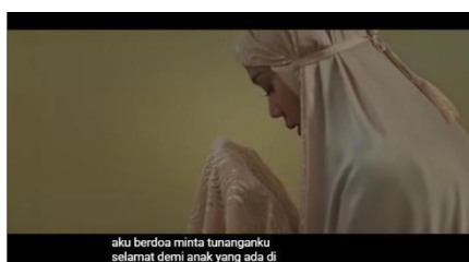
Gambar 2. Seorang Wanita yang sedang Berdoa Setelah Salat

Dalam film “ Atas Nama Surga ” juga terdapat data lain yang merepresentasikan nilai ilahiyah dimensi ibadah pada adegan tokoh Naya yang sedang melaksanakan doa dengan mengenakan mukenah dan menengadahkan tangan dalam keadaan penuh cemas. Saat itu, tokoh Naya sedang mengalami ujian hidup ketika mengetahui sang kekasih terbaring lemah menjalani perawatan di rumah sakit. Tokoh Naya lalu memutuskan berdoa kepada Allah SWT untuk kesembuhan sang kekasih sebagai bentuk ikhtiar spiritual. Dalam adegan tersebut, diperkuat dengan dialog tokoh Attar dan Naya sebagai backsound . Dalam dialog tersebut Naya sempat merasa khawatir mengenai kemungkinan doanya tidak dikabulkan sehingga membuat Attar menyampaikan penjelasan bahwa Allah SWT Maha Mendengar doa hamba-Nya yang sungguh-sungguh dan kemudian manusia hendaknya bersikap ikhlas dan berserah diri kepada Allah SWT karena Allah SWT tidak memberikan ujian di luar kemampuan hamba-Nya. Rangkaian adegan yang menampilkan tanda visual dan verbal memperlihatkan bahwa ibadah sebagai bentuk pendekatan diri kepada Allah SWT.