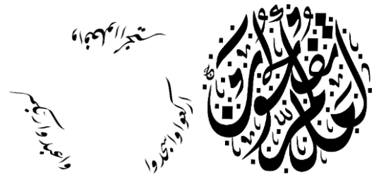
Gambar 3. Proses Penulisan 3 Gambar 4. Proses Penulisan 4