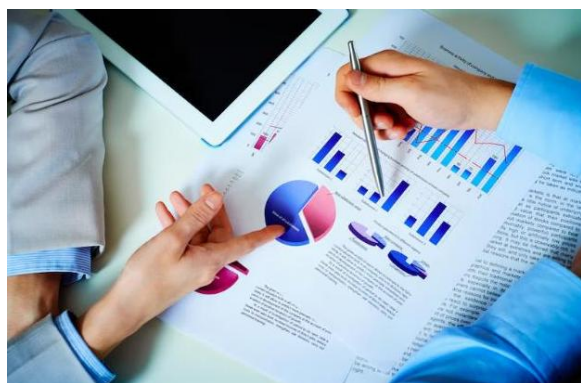
Gambar 1. Mencari Data

Penelitian ini menggunakan pendekatan kualitatif dengan metode studi pustaka ( library research ). Pendekatan kualitatif dipilih karena penelitian berfokus pada analisis makna, nilai, dan konsep etnopedagogi dalam perspektif falsafah Al-Qur'an. Studi pustaka dilakukan dengan mengumpulkan berbagai sumber ilmiah seperti buku, jurnal, artikel akademik, serta tafsir Al-Qur'an yang relevan dengan tema penelitian. Pendekatan ini bertujuan untuk memperoleh pemahaman mendalam mengenai hubungan antara nilai budaya lokal dan nilai pendidikan Islam dalam Al-Qur'an.