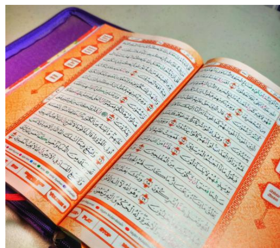
Gambar 1. Mencari data

Teknik pengumpulan data dilakukan melalui dokumentasi dan studi literatur. Peneliti mengumpulkan berbagai referensi yang berkaitan dengan tema penelitian, kemudian melakukan identifikasi, klasifikasi, dan seleksi data berdasarkan relevansi pembahasan. Dalam proses ini, peneliti juga menelaah berbagai pendapat mufasir klasik maupun modern mengenai hubungan antara otoritas teks dan dinamika makna dalam penafsiran Al-Qur'an. Teknik dokumentasi dipilih karena mampu memberikan data yang sistematis dan mendalam mengenai perkembangan epistemologi qawa'id tafsir dari masa klasik hingga kontemporer (Sugiyono, 2019).