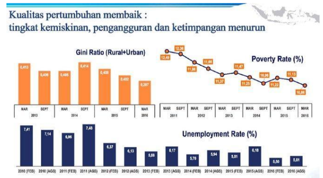
Gambar 4. Grafik Strategi Pembangunan Ekonomi Inklusif di Indonesia

Berdasarkan tabel di atas, terdapat berbagai strategi efektif untuk mengurangi ketimpangan pendapatan dan kemiskinan. Peningkatan pendidikan meningkatkan kualitas sumber daya manusia, sedangkan pembangunan infrastruktur memperluas akses ekonomi masyarakat. Pengembangan UMKM berperan menaikkan pendapatan, pemberian bantuan sosial meringankan beban kelompok miskin, dan perluasan lapangan kerja berpotensi menurunkan jumlah pengangguran secara signifikan.