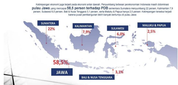
Gambar 1. Ketimpangan Pembangunan Antarwilayah di Indonesia

Berdasarkan gambar di atas, terlihat adanya ketimpangan wilayah yang cukup tajam di Indonesia, di mana pulau Jawa mendominasi perekonomian nasional dengan kontribusi sebesar 58,5% terhadap PDB. Sementara itu, wilayah lain memiliki persentase yang jauh lebih kecil: Sumatera 22,2%, Kalimantan 7,9%, Sulawesi 6,0%, Bali & Nusa Tenggara 3,1%, serta Maluku & Papua hanya 2,5%. Ketimpangan ini menunjukkan bahwa pertumbuhan ekonomi masih sangat terpusat di Jawa, sementara wilayah lain belum berkembang secepat dan sebesar pulau utama tersebut.