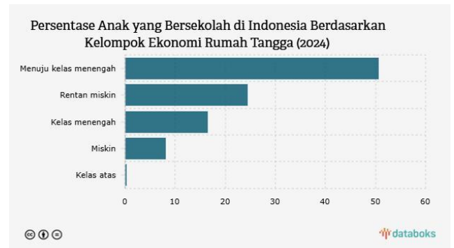
Gambar 3. Grafik Ketimpangan Pendidikan dan Kemiskinan di Indonesia

Dalam jangka panjang, kondisi tersebut dapat memperbesar kemiskinan struktural karena rendahnya pendidikan akan memengaruhi produktivitas tenaga kerja dan tingkat pendapatan masyarakat secara berkelanjutan (OECD, 2023)